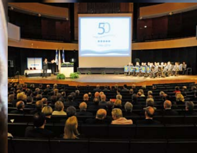
Pääjuhla vietettiin upeissa puitteissa, taso maailman huippua...