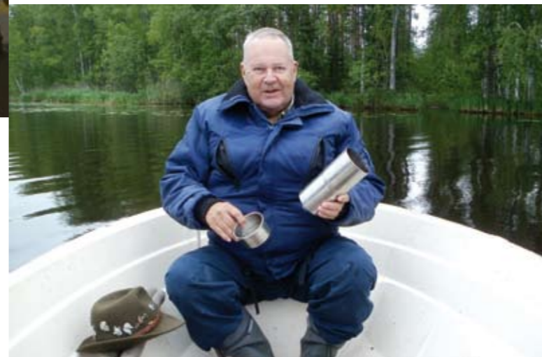
Ilkka Suominen kalassa Vanajavedellä kesäkuussa 2010

SAHL:n kunniapuheenjohtaja, ministeri Ilkka Suominen tervehtii 50 vuotta täyttäneitä Ampumahiihtoliittoa.