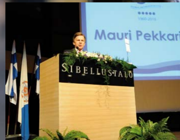
Pääjuhlan päätöissanat; SAHL varapuheenjohtaja Mauri Pekkarinen