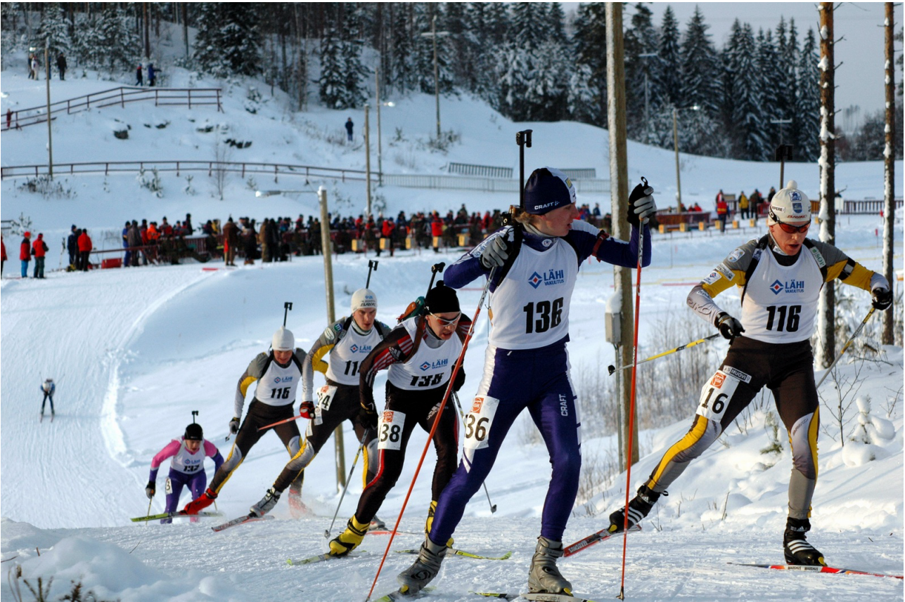
SM –kilpailut Keuruulla.