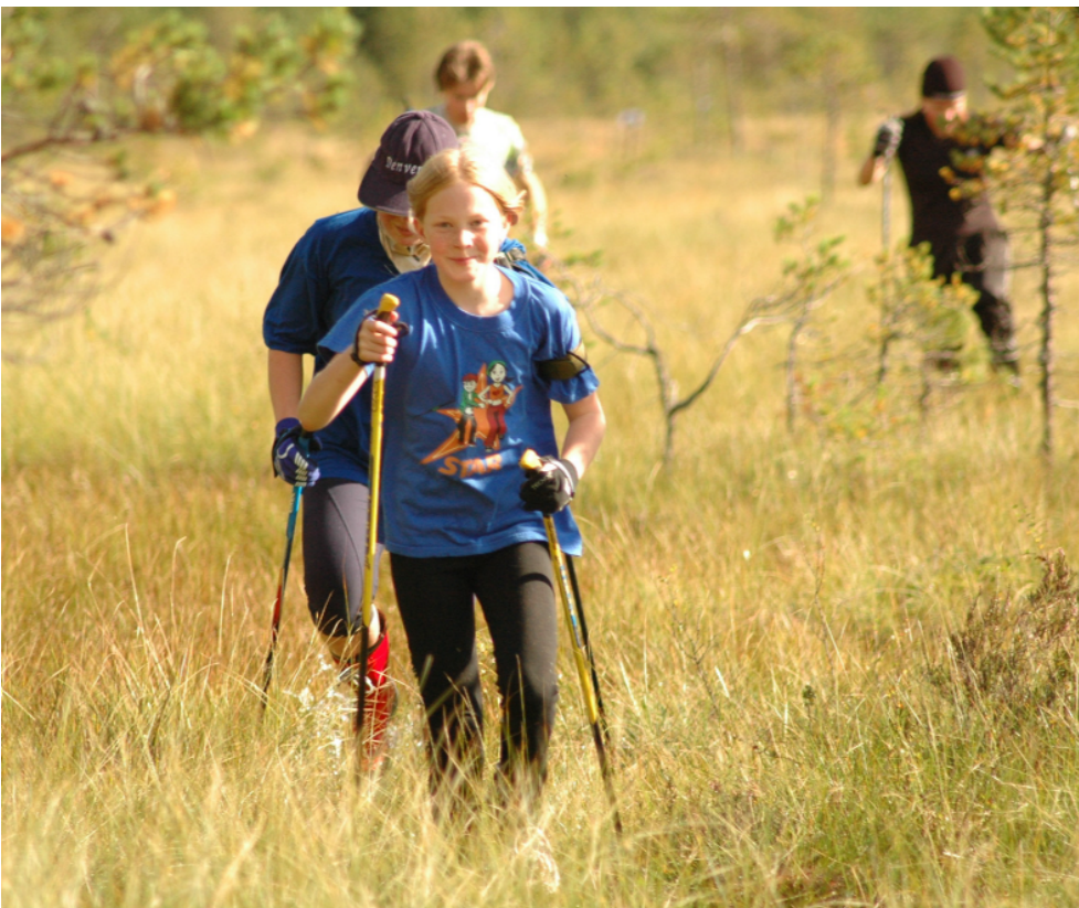
Kesällä ampumahiihtäjät tehdään